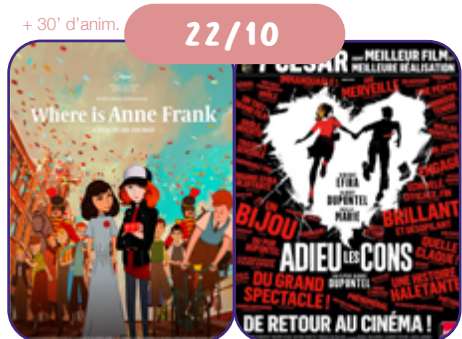
de A. Folman BE/FR/IL/NL | 2021 | 99' | VF