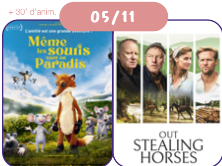
de D. Grimmová & J. Bubeníček CZ/SK | 2021 | 85' | VF