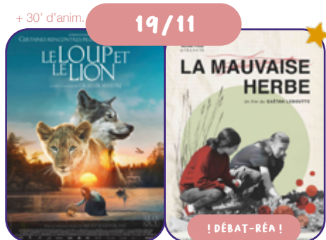
de G. de Maistre FR/CA | 2021 | 99' | VF