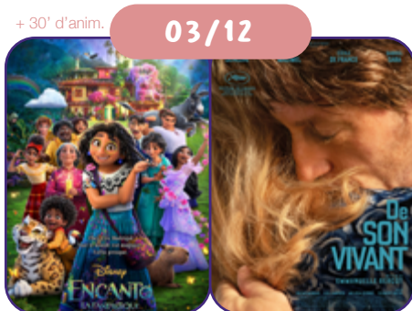
de D. Scanlon USA | 2021 | 109' | VF