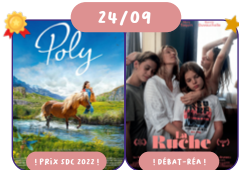
de N. Vanier FR | 2020 | 102' | VO FR