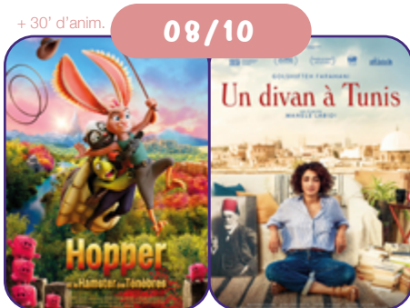
de B. Stassen et B. Mousquet BE/FR | 2022 | 90' | VF